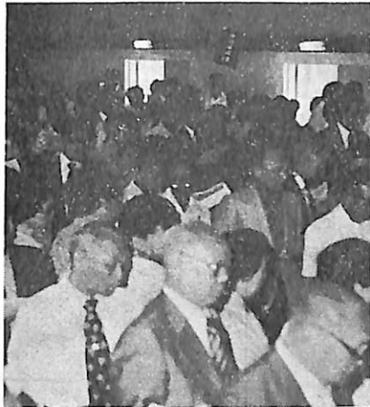
これからこの風景を合奏する。会場を埋め尽くす総会と「ふるさと」の唱歌