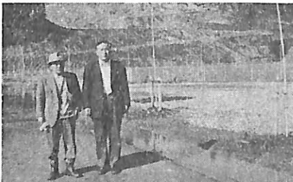
の苗木。運動広場に。二百本の中百本は朝日新聞より寄贈された。写真(人物の左は協議会長、右は事務局長さん)

文部省の「ふるさと運動」の一環として、県下二か所に建設されることになった、その中のひとつが片貝に、只今建築中であることはずせにお知らせの通りです。 建物は十一月末に完成、内部の諸設備が整備されて、開館されるのもそう遠くない見込み。町の集会所や各種の教養講座など、幅広い利用が期待されている。ゆくゆくは宿泊もできるよう、検討中とのことである。 場所は浅原神社の拝殿の左側。鉄筋二階建。延床面積は百六十坪。大広間、和室、調理室、研究室、浴室が主な構成になっている。総工費五千四百万円。 (下はのたび会から寄贈した桜)