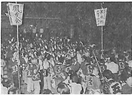
神社拝殿前で木やりを唄う鳳友会の人たち

年毎に賑やかさを増している秋祭りは、今年も九月九、十日に盛大に行われた。両日も、よい日和に恵まれ、参詣の人達の心はいやが上り、浮き上がった。例年多少なりとも雨がばらつくのに、こんなにおだやかなよい祭りはなかった、と異口同音に皆さんが顔を輝かせていた。昨秋立派に修復された社殿も、ひと際輝きを増したように感ぜられる。 初孫誕生、先祖の供養、新築、結婚祝いなど、数々の喜びと思いをこめた花火は勿論のこと、各年の同級会同志が、久々に旧交を